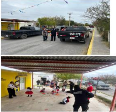
DIRECCIÓN: EJIDO PRIMERO DE MAYO CALLE OREGON S/N