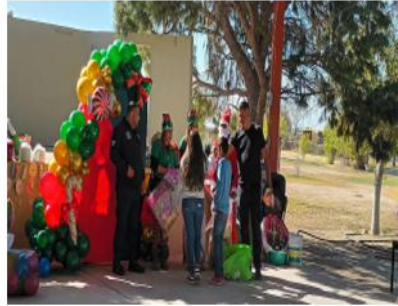
DIRECCIÓN: EJIDO PRIMERO DE MAYO CALLE OREGON S/N