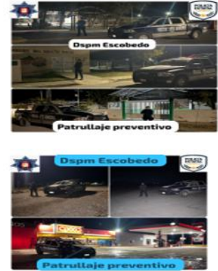
DIRECCIÓN: EJIDO PRIMERO DE MAYO CALLE OREGON S/N