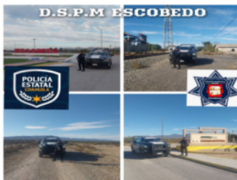
TERCERO.- Relativo a la Fracción IV. Con respecto con Usted lo siguiente: